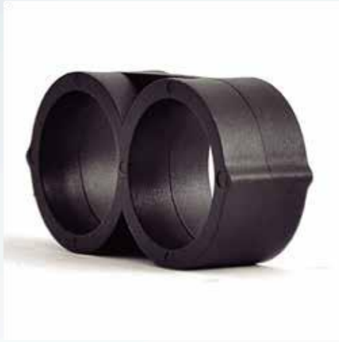
FINAL DE LINEA MANGUERA