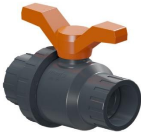
VÁLVULAS ESFERICAS MEDIA UNIÓN