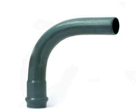
CURVA 90° TERMOF. J/ GOMA