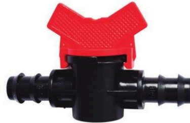
MINI VÁLVULA MANGUERA-