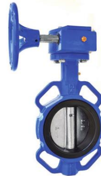
VÁLVULA MARIPOSA CON VOLANTE