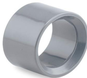
CASQUILLO RED. JP