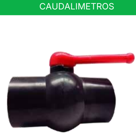
VÁLVULA BOLAESFERICA JP