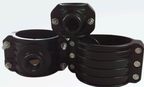
ABRAZADERAS CON DERIVACIÓN