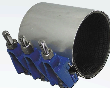
ABRAZADERA REPARACIÓN METÁLICA