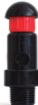
VÁLVULA DE AIRE SIMPLE EFECTO 1"