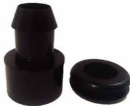
INICIAL HEMBRA 1" / MACHO 1-1/4" CON GOMA