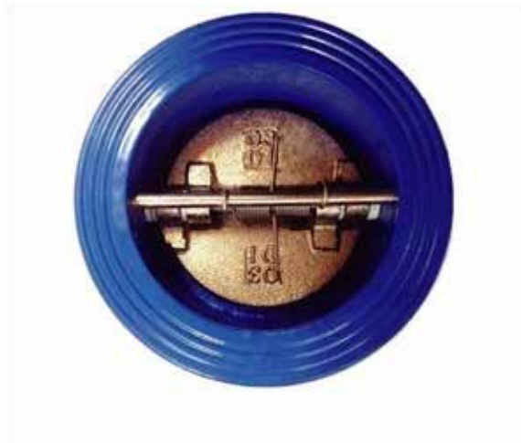
VÁLVULA DUO CHECK