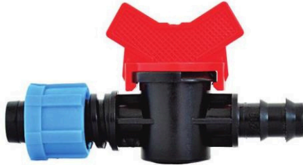
MINI VÁLVULA MANGUERA -