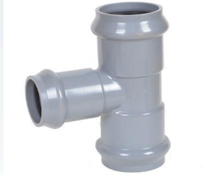
TEE PVC INYECTADA J/ GOMA