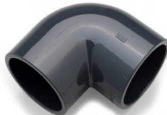
CODO 90° PVC