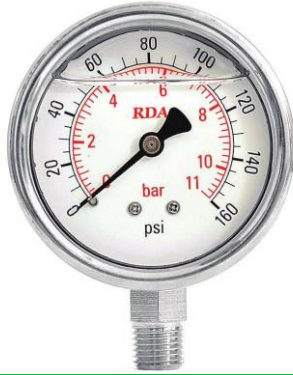
MANÓMETRO DE GLICERINA