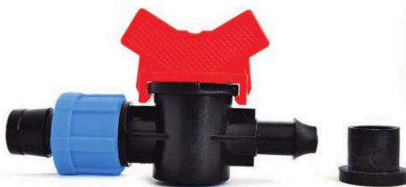
MINI VÁLVULA INICIAL-CINTA