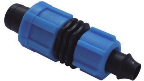
CONECTOR CINTA CONTRATUERCA