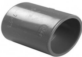
CUPLA PVC JP