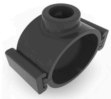
ABRAZADERA CON CUÑA