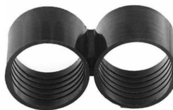
FINAL DE LINEA P/ MANGUERA