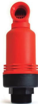
VÁLVULA DE AIRE DOBLE EFECTO 2"