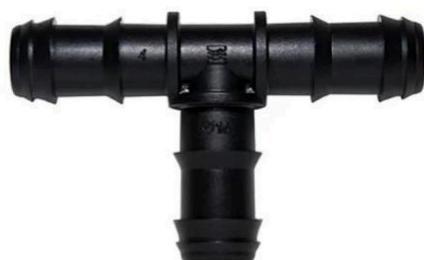
CONECTOR CODO CINTA-CINTA