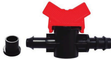
MINI VÁLVULA INICIAL-MANGUERA