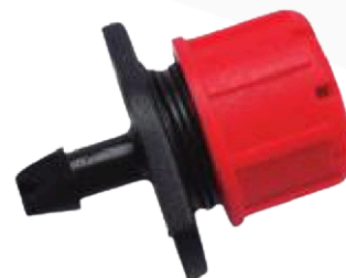
GOTERO REGULABLE 0-70 L/H