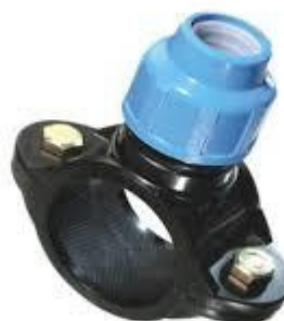
ABRAZADERA C/ RACORD