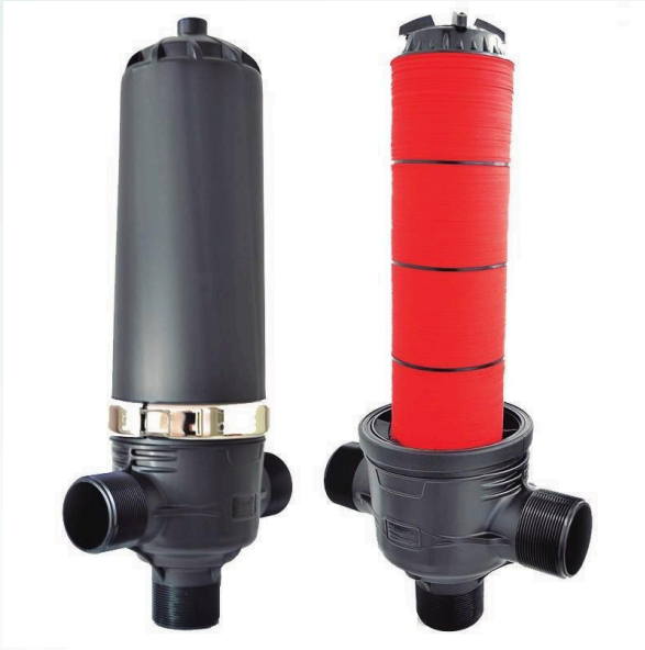
FILTRO DE ANILLA EN TEE