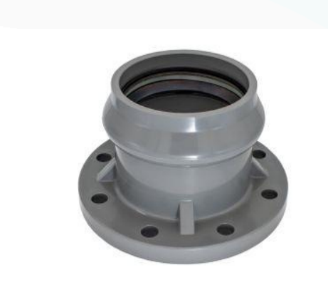
ADAPTADOR BRIDA J/ GOMA