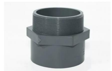
MANGUITOS PVC ROSCADO