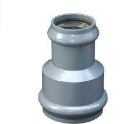
REDUCCIÓN INY. PVC J/ GOMA