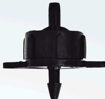
GOTERO AUTO COMPENSADO 4 L/H