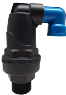
VÁLVULA DE AIRE TRIPLE EFECTO 2"