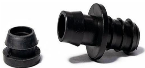
CONECTOR INICIAL C/ GOMA