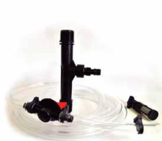
KIT INYECTOR TIPO VENTURI