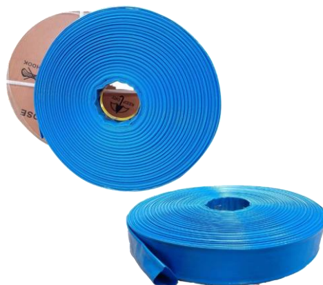
MANGUERA LAY FLAT