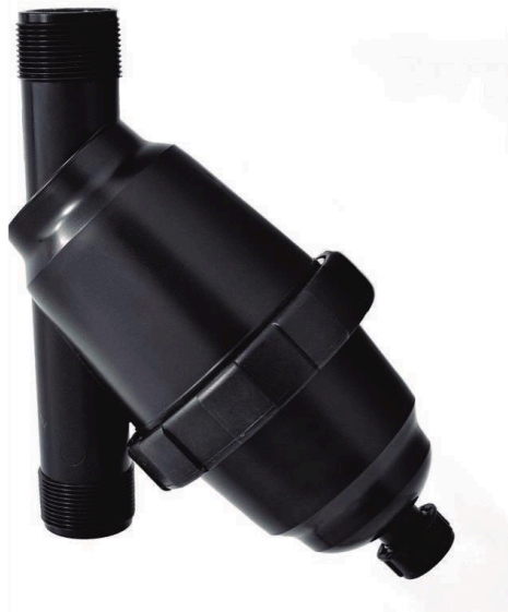
FILTRO DE MALLA EN Y