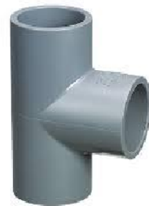
TE 90° PVC