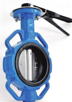
MARIPOSA TIPO WAFER