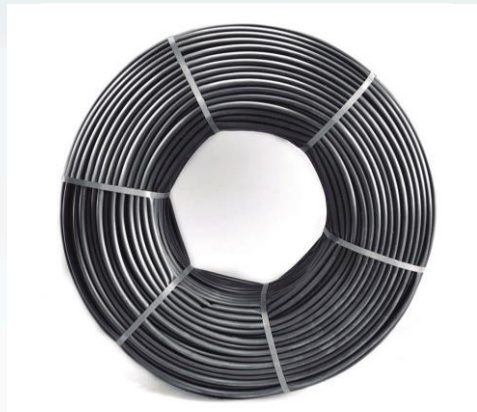
TUBERÍA CIEGA 16mm-20mm