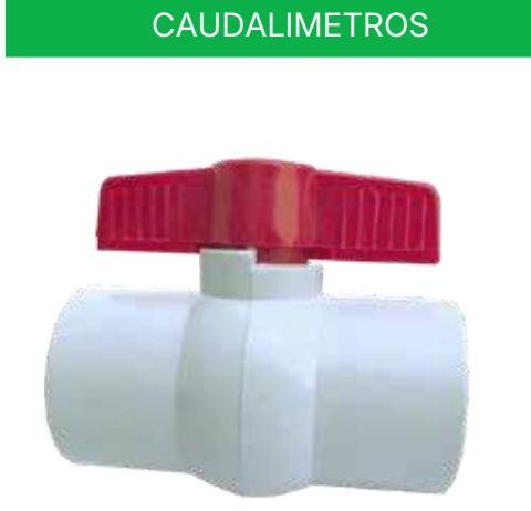
VÁLVULA ESFERICA ROSCADA