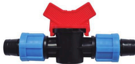
MINI VÁLVULA CINTA-CINTA