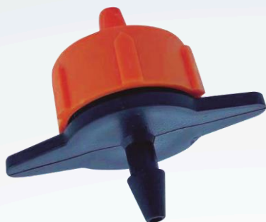
GOTERO AUTO COMPENSADO 2 L/H