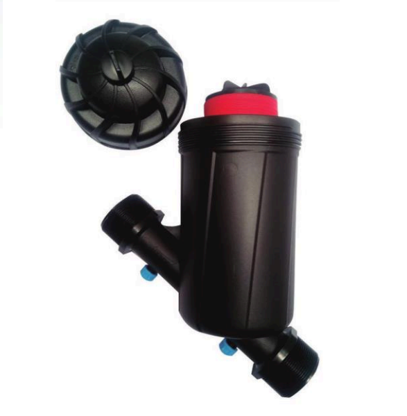
FILTRO DE ANILLA EN Y