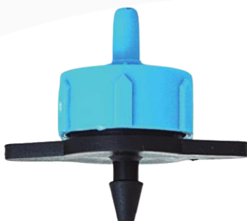
GOTERO AUTO COMPENSADO 8 L/H