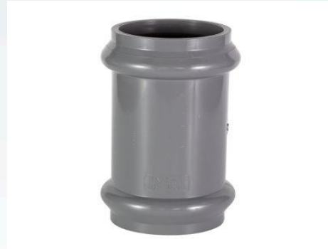
CUPLA PVC INYECTADA J/ GOMA